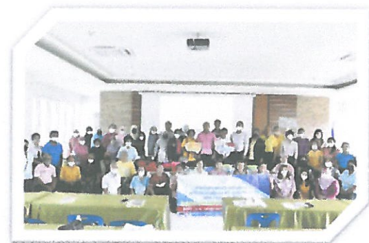
โครงการส่งเสริมความรู้และพัฒนาคุณภาพชีวิตเยาวชน สตรี ผู้สูงอายุ ผู้พิการ และผู้ด้อยโอกาสทางสังคม