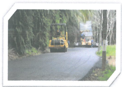
โครงการปรับปรุงผิวจราจรถนนสายนาหนองพันกัน -หน้าอิง หมู่ที่ 9-หมู่ที่ 1