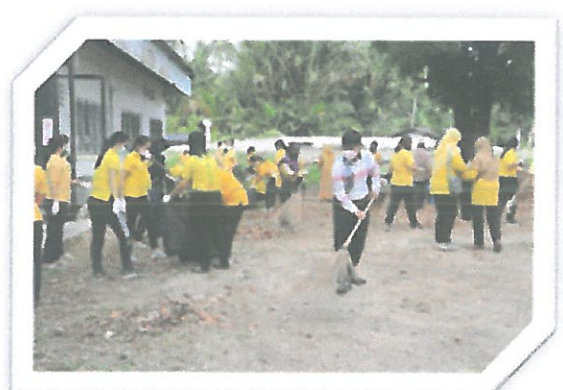
โครงการรณรงค์เมืองสะอาด