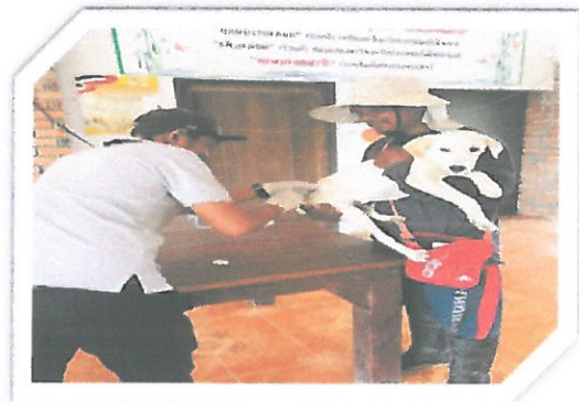
โครงการสัตว์ปลอดโรค คนปลอดภัยจากโรคพิษสุนัขบ้าตามพระปณิธานศาสตราจารย์ ดร.สมเด็จพระเจ้าอ้นมโหรี เจ้าฟ้าจุฬาภรณวลัยลักษณ์ อัครราชกุมารี กรมพระศรีสวางควัฒนวรขัตติยราชนารี