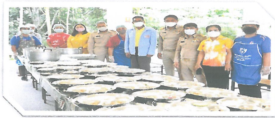
โครงการอุดหนุนอาหารกลางวันสำหรับนักเรียน