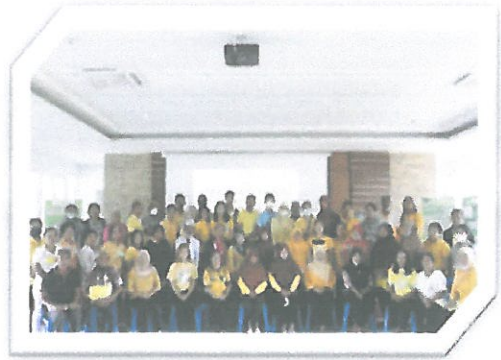
โครงการธนาคารขยะ