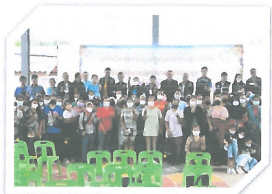
โครงการมอบรางวัลแก่ผู้ปกครองนักเรียนของศูนย์พัฒนาเด็กเล็ก