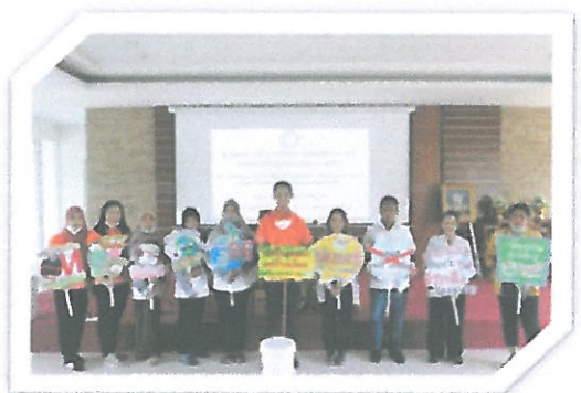
โครงการส่งเสริมการมีส่วนร่วมในการอนุรักษ์ทรัพยากรธรรมชาติและสิ่งแวดล้อม