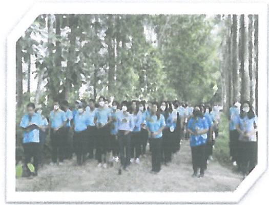
โครงการปลูกต้นไม้ทำบุญแจกปล่อยพันธุ์สัตว์น้ำลงสู่แหล่งน้ำธรรมชาติเนื่องในโอกาสและวันสำคัญต่าง ๆ