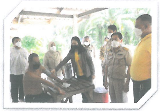
โครงการเยี่ยมบ้านผู้สูงอายุ คนพิการ ผู้ด้อยโอกาส