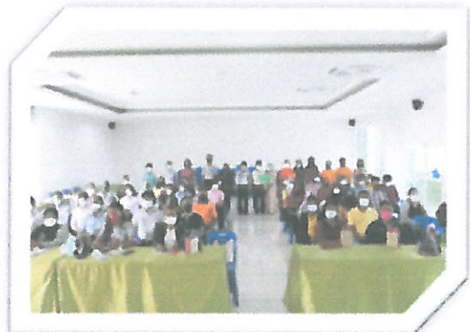
โครงการส่งเสริมอาชีพการเกษตรตามแนวเศรษฐกิจพอเพียง