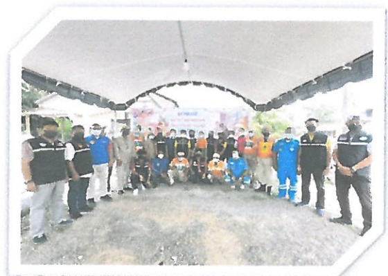
โครงการลดอุบัติเหตุทางถนนในเทศกาลต่าง ๆ