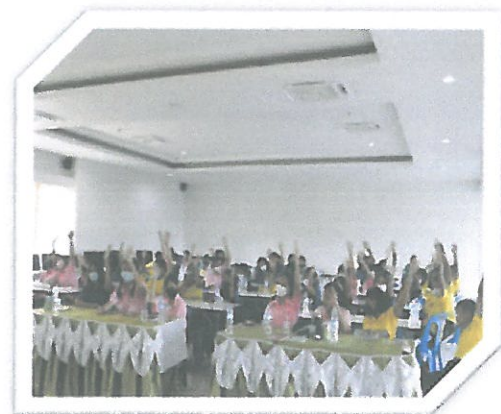
โครงการรณรงค์ป้องกันและแก้ไขปัญหายาเสพติด TO BE NUMBER ONE