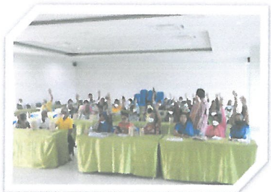
โครงการเพิ่มศักยภาพผู้สูงอายุเทศบาลตำบลกระปี่น้อย