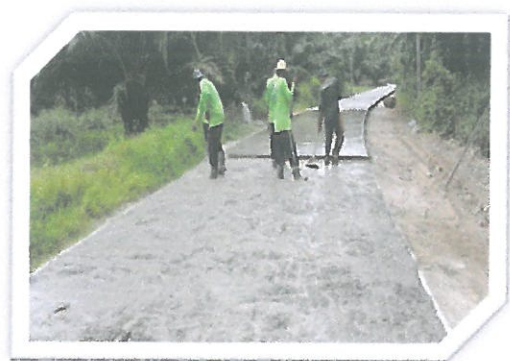
โครงการก่อสร้างถนน คสล.สายท่าเรือ 3 หมู่ที่ 1