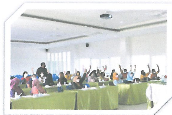
โครงการพัฒนาทักษะอาชีพเกษตรตำบลกระป๋องน้อย