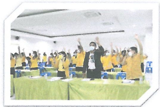
โครงการอบรมเพิ่มประสิทธิภาพการปฏิบัติงานของบุคลากรเทศบาลตำบลระษะบับน้อย