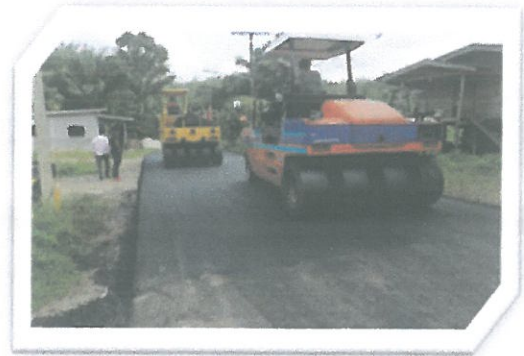
โครงการปรับปรุงผิวจราจรถนนสายหนองคล้า-นาดีน หมู่ที่ 7 (ช่วงที่ 3)