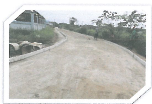
โครงการก่อสร้างถนน คลลขอยหลังผิง หมู่ที่ 2