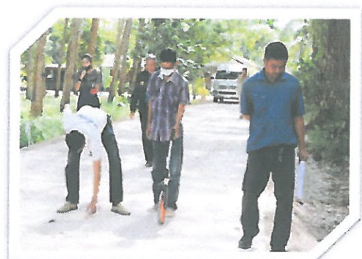
โครงการก่อสร้างถนน คลลขอยน้ำพอง หมู่ที่ 6