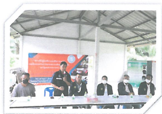
โครงการสัมมนาเชิงปฏิบัติการเพื่อการจัดทำแผนพัฒนาของเทศบาลตำบลกระปี่น้อย