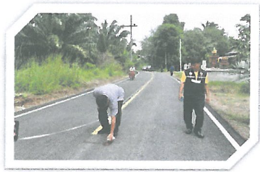
โครงการซ่อมสร้างถนนลาดยางสายโคกขี้เหล็ก หมู่ที่ 3 (ช่วงที่ 1)