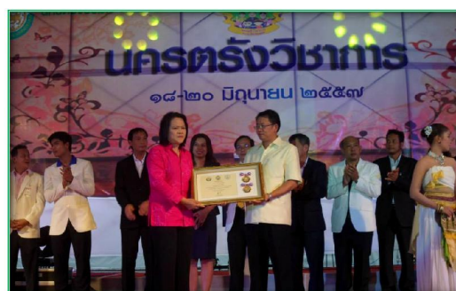
โครงการแข่งขันทักษะทางวิชาการ