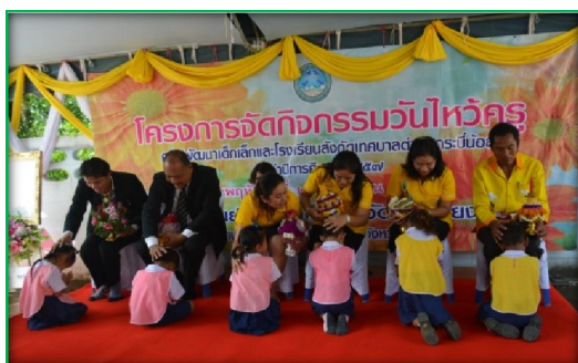
โครงการจัดกิจกรรมวันไหว้ครู