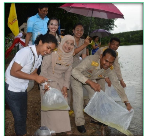
โครงการปล่อยพันธุ์สัตว์น้ำ