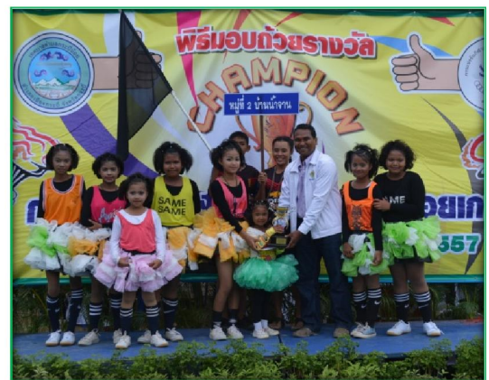
โครงการจัดการแข่งขันกีฬาเทศบาลตำบลกระบี่น้อยเกมส์ด้านกอล์ฟเซฟตี้ ครั้งที่ ๒