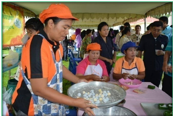
โครงการคลินิกเกษตรเคลื่อนที่ในพระราชานุเคราะห์สมเด็จพระบรมโอรสาธิราชสยามมกุฎราชกุมาร