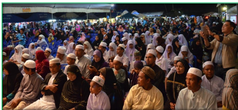
โครงการจัดงานเมาลิดกลางตำบลกระปี่น้อย