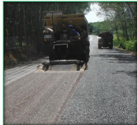
โครงการก่อสร้างถนนลาดยางสายบ้านเขาตั้ง - บ้านโพธิ์เรียง (โครงการ MOC)