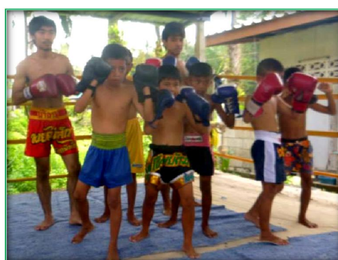
โครงการส่งเสริมการอนุรักษ์ศิลปะมวยไทยและการออกกำลังกายเพื่อสุขภาพมวลชน