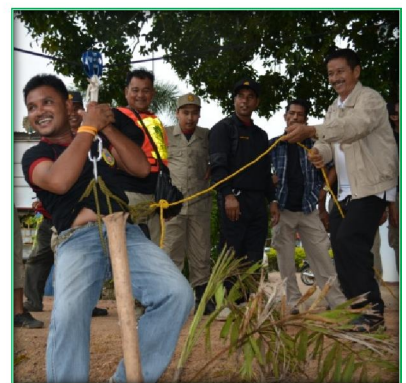
โครงการฝึกอบรมซ้อมแผนป้องกันและบรรเทาสาธารณภัย