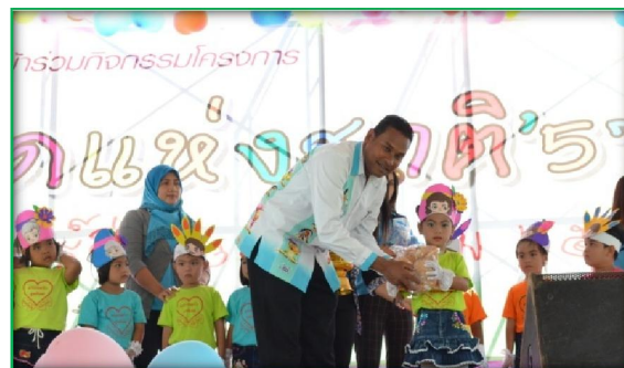
โครงการจัดกิจกรรมงานวันเด็กแห่งชาติ