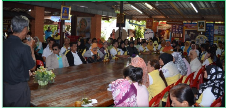
โครงการทัศนศึกษาดูงานของ อสม. ตำบลกระบี่น้อย