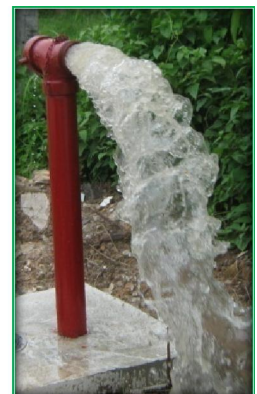
โครงการขยายเขตจ่ายน้ำประปาภูมิภาค