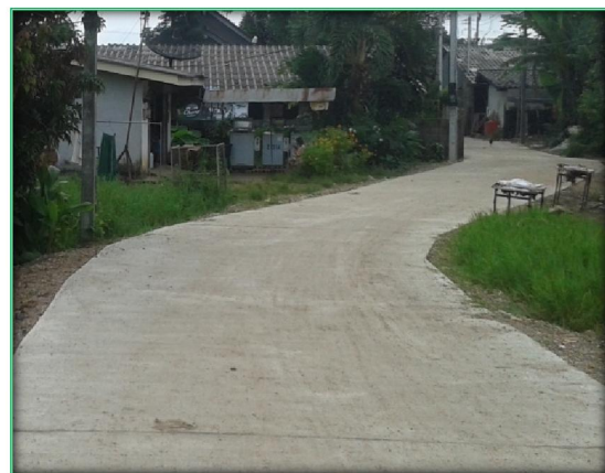
โครงการก่อสร้างถนนคอนกรีตเสริมเหล็ก

๒๑. โครงการก่อสร้างถนนคอนกรีตเสริมเหล็กสายข้างอุ้งเกียรติเจริญ บ้านนาอก ฝัวจราจร คอนกรีตเสริมเหล็กกว้าง ๔.๐๐ เมตร หนา ๐.๑๕ เมตร ระยะทาง ๑๔๕ เมตร งบประมาณ ๓๘๔,๙๐๐ บาท