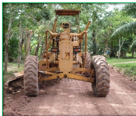
โครงการซ่อมแซมถนนลูกรัง

๓๑. โครงการซ่อมแซมถนนลูกรังสายบ้านนายประมวล-ห้วยทับไธ, สายหลังวัดกระปี่น้อย, สาย โคกแก้ว งบประมาณ ๙๗,๐๐๐ บาท