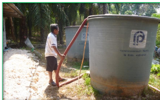
โครงการช่วยเหลือผู้ประสบภัยแล้งตำบลกระปี่น้อย

นอกจากนี้เทศบาลตำบลกระปี่น้อยได้ดำเนินการช่วยเหลือประชาชนในกรณีที่ประสบภัยต่างๆ ทางธรรมชาติ ได้แก่ ภัยแล้ง อุทกภัย วาตภัย และอัคคีภัย และได้สร้างภาคีเครือข่ายกับหน่วยงานต่างๆ ในการช่วยเหลือประชาชนในด้านการป้องกันและบรรเทาสาธารณภัย ได้แก่ แขวงทางกระบี่ สำนักงานป้องกันและบรรเทาสาธารณภัยจังหวัดกระบี่ เทศบาลเมืองกระบี่ เทศบาลตำบลเหนือคลอง เทศบาลตำบลเขาพนม และองค์กรปกครองส่วนท้องถิ่นต่างๆ เป็นต้น