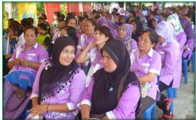
โครงการป้องกันควบคุมโรคไข้เลือดออกโดยการมีส่วนร่วมของชุมชน